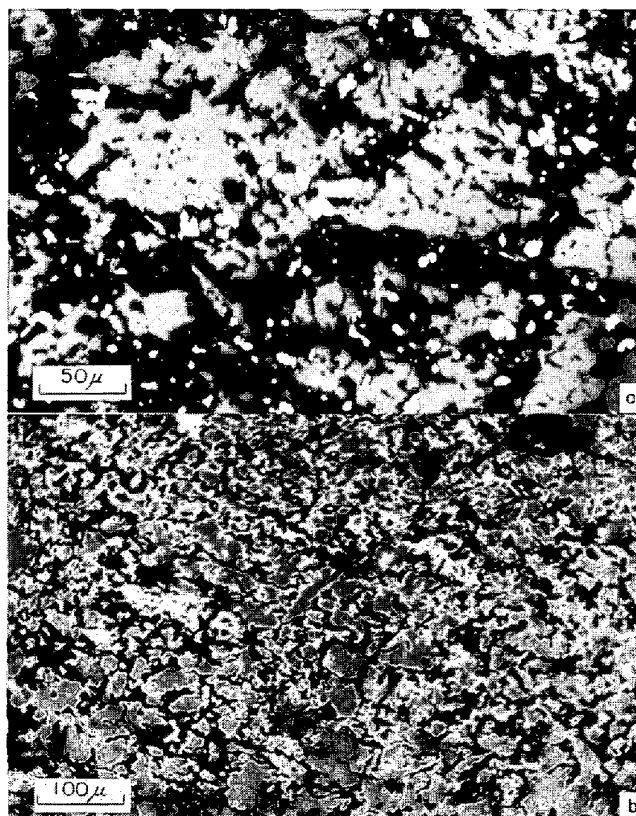
a) Produced from the concentrate retaining sodium chloride (51.6% of reduction degree) b) Produced from the concentrate free of sodium chloride (54.8%)