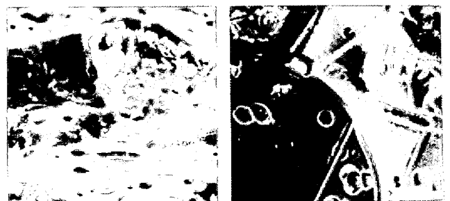
a. 溶体化処理 X600 b. 二相化処理 X600 写真1. 水素チャージした304Lステンレス鋼の破面