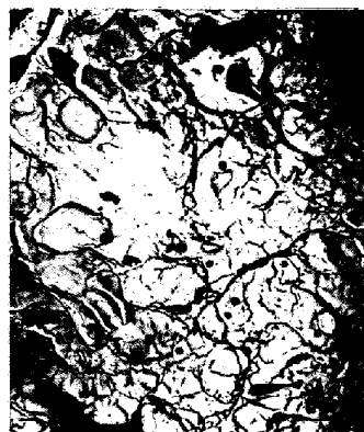
写真5 写真3の電子顕微鏡像