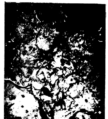
写真6 写真4の電子顕微鏡像