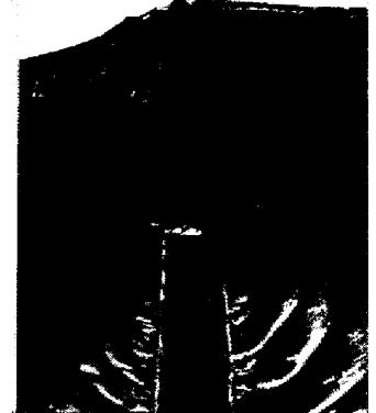
写真4 チルハゲ片の疲労模様部