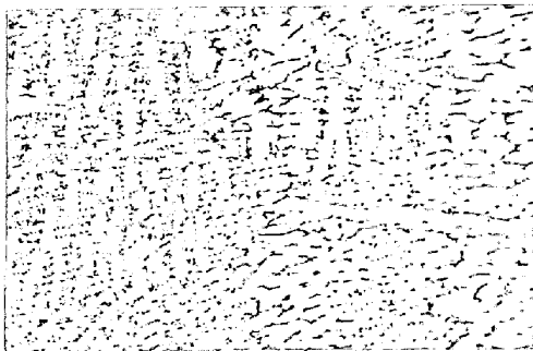
写真1 TIG溶接部 (溶接のまま ×50)