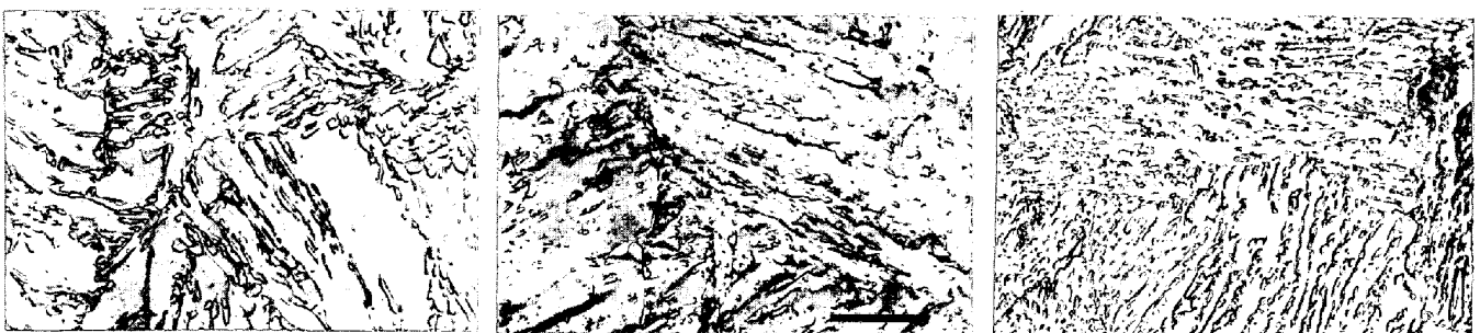
9Ni-0.8Mn-0.1C 800°C(1h)AC, 600°C(1h)WQ