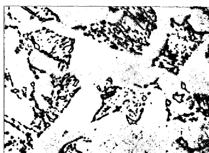
(c) Fe - C - Ni