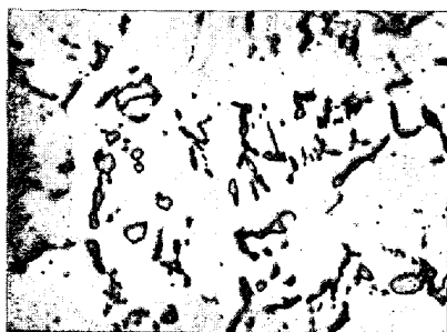
(a) Fe - C