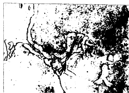
写真1 10K材を695℃で恒温変態後にみられるデイボースト・パーライト組織 (×2000)