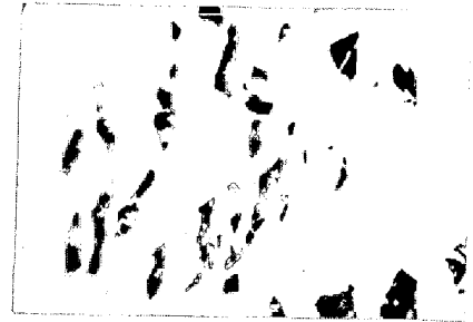
写真1 圧延方向 10μ (鋼板表面研磨) 冷延鋼板表面疵の要因介在物例 XMA分析 Al 2 O 3 24 SiO 2 56 (%) Mn 13 FeO 6

スリバーの内には鋳型内壁付着スカムが還元されて発生した表面CO気泡によるスラブ線状疵にもとづくものもある。またスラブホットスカーフ時に酸化が進行して、その後の手入れで十分除去されない線状疵が、鋼板ではスケール介在物として観察される場合もある。