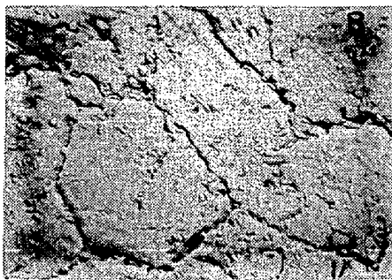
写真 1 電顕組織 (X8200)