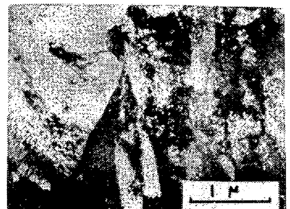
写真1 時効材の透過電顕写真