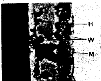
第1図 (×500× \frac{2}{3} )