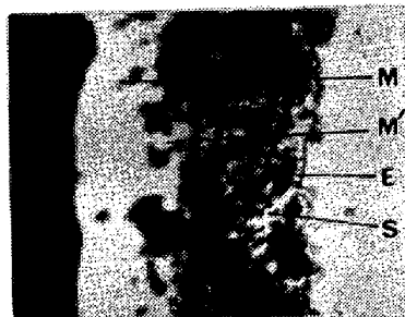
第4図 (×500× \frac{2}{3} )