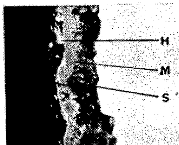
第2図 (×800× \frac{2}{3} )