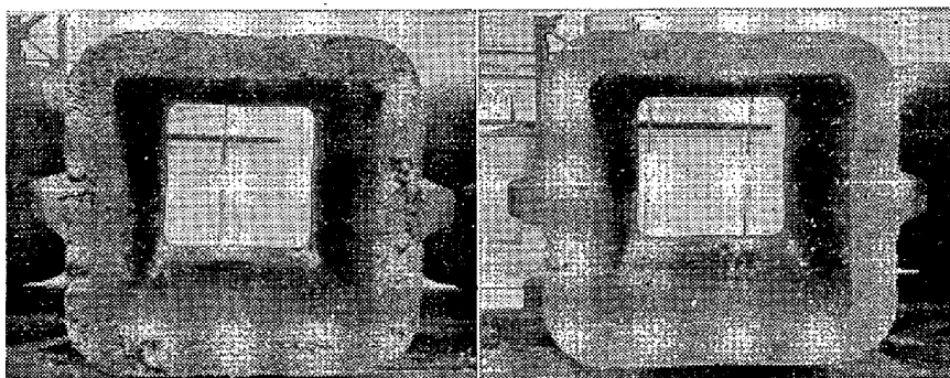
(a) Top pouring