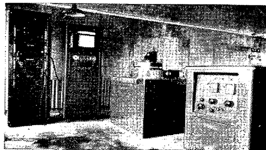
Photo. 1. Appearance of the fluorescent X-ray analyzer.

レット式)、(5)LiF 彎曲結晶、(6)scintillation 計数管、(7)比例増巾器、(8)波高分析器、(9)計数回路(10)計数率計、(11)時計、(12)定時計数法・定計数法測定装置、(13)Chart 記録計、(14)読取メータ—連動機構(15)読取メータ、の要素より成つており、これに冷却水回路が付属し装置全体に防X線・防電撃装置がなされている。現在は鉛1元素の専用装置であるが、系列(計数管および結晶)を増加することにより、6元素まで測定可能である。