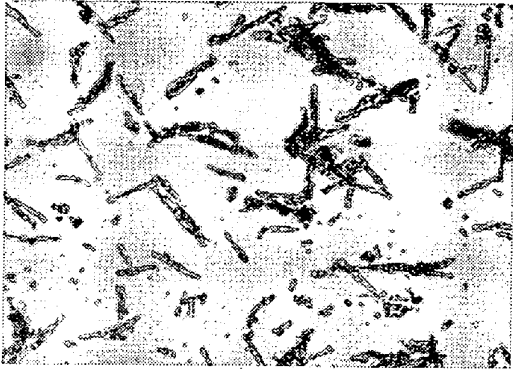
Photo. 2. Extracted inclusions of forged steel ingots.

Mn で脱酸を行なっているが Mn の脱酸力は弱いから介在物の主成分は FeO である。そして球状 Wüstite 介在物に近い珪酸塩であり, Mn により淡褐色に着色している。そして溶融点が低いから鍛造によりいちじるしく伸びている。(Photo. 2)