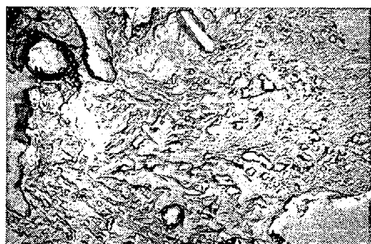
Fig. 3. Electron microscopic structure of No. 5 specimen. \times 3600(1/2)

また Si が低い程、耐磨耗性は向上した。これはやはり Fe, Cr 炭化物の影響で、顕微鏡組織によると、C 2.5% では初晶はオーステナイトであるが、C4% では初晶は \eta 炭化物である。すなわち磨耗に強くなるのであるが、この反面 Si が高くなると \eta 炭化物は初晶として出なく \alpha 地を増加せしめる傾向にある。さらに三元共(包)晶の微細組織を検討するため、電子顕微鏡観察を行った。Fig. 2, Fig. 3 はその一例で試料は Table 1 No. 5 である。