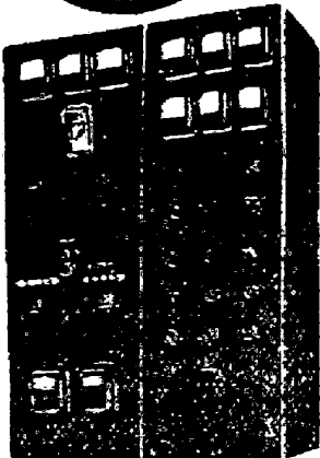
電弧爐アブリダイン用制御盤