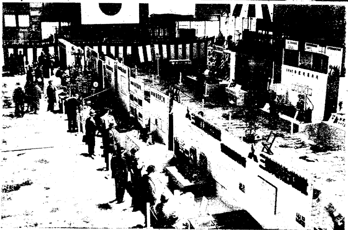
↑ 第二十七回通常總會に於ける表彰式