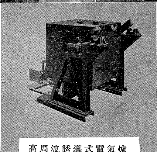
高周波誘導式電氣爐