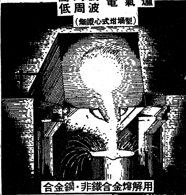
合金鋼・非鐵合金熔解用