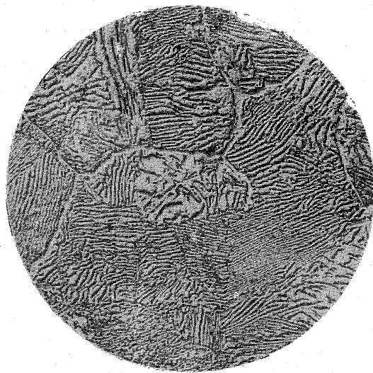
4mm apochromatic 750 × mag oblique limitation