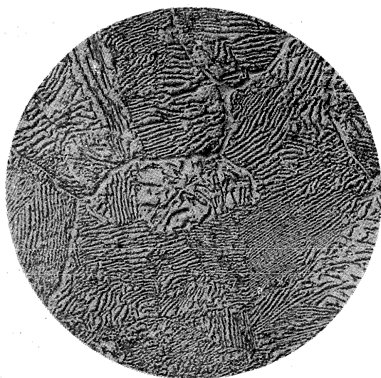
4mm apochromatic 750 × mag oblique limitation