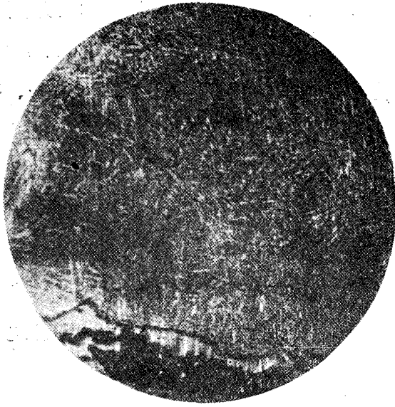
Temp. 950°C Benzol と Nitrogen とにて 2 時間 Cementatin を行ひ且つ其温度から Oil Quench したもの