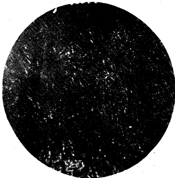
Temp. 950 °C Benzol と Nitrogen とにて 1 時間 Cementatin を行ひ且つ其温度から Oil Quench したもの