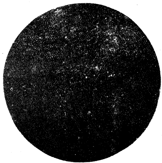
Temp. 950 °C Benzol と Nitrogen とにて 3 時間 Cementatin を行ひ且つ其温度から Oil Quench したもの